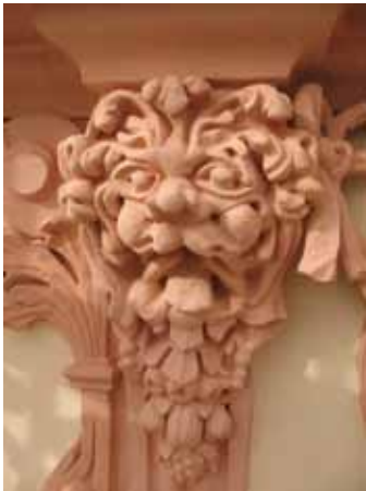
oben: Innsbruck, Herzog-Friedrich-Straße 3, Altes Regierungsgebäude, Claudiana, Stuckdetail © BDA rechts: Kufstein, Rathaus © BDA