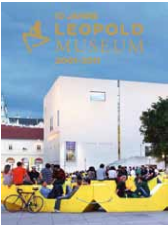
10 Jahres Buch Cover © Stiftung Leopold

Electronics realisiert werden konnte. Die renommierte Lichtkünstlerin Waltraut Cooper konzipierte anlässlich des Jubiläums die Lichtinstallation Éclairs Léopold . Fritz Fitzke ließ Schieles Werke im Zuge der Jubiläumsfeierlichkeiten rund um die Eröffnung der Ausstellung Melancholie und Provokation . Das Egon Schiele Projekt an den Innenwänden des Leopold Museum mittels Videoinstallationen lebendig werden. Das Lichtkunstkollektiv LICHTTAPETE bespielte das Leopold Museum innen und außen mit beeindruckenden, von Schieles Œuvre inspirierten Bildcollagen.