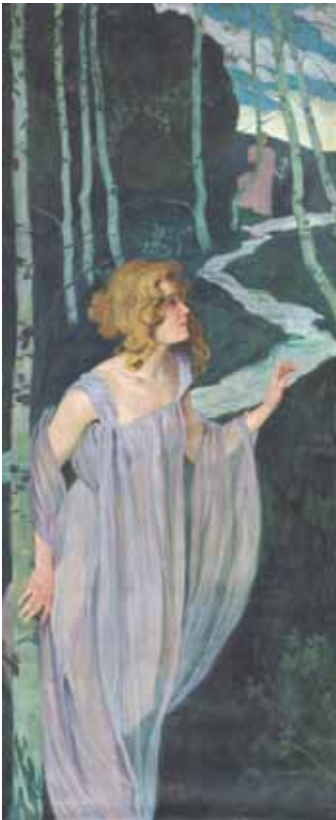
Elfe am Bach