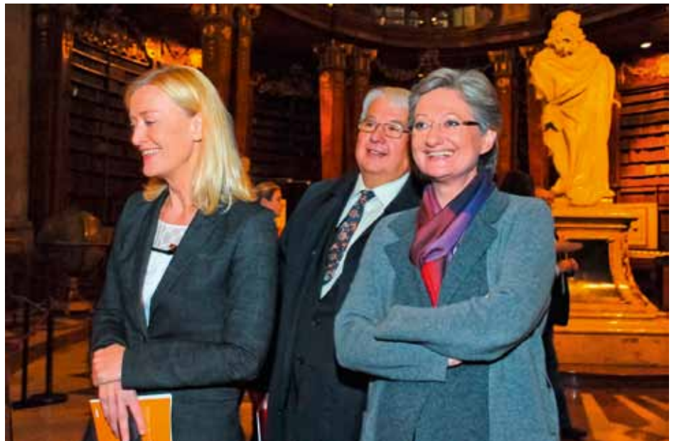
Bundesministerin Dr. Claudia Schmied und Generaldirektorin Dr. Johanna Rachinger bei der Eröffnung der Ausstellung: Von Fischen, Vögeln und Reptilien. Meisterwerke aus den kaiserlichen Sammlungen

Juden, Christen und Muslime. Interkultureller Dialog in alten Schriften Nationalbibliothek von Aserbeidschan, Baku 12. April – 12. August 2011