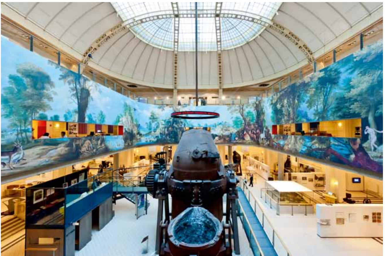
In Arbeit

Der thematische Schwerpunkt Arbeit (2011/2012) wurde im Oktober mit dem großen Ausstellungsprojekt IN ARBEIT – Die Ausstellung zur Dynamik des Arbeitslebens eingeleitet. In zwei Ausstellungsteilen wurde das Thema für unterschiedliche Zielgruppen entwickelt und umgesetzt: Der kulturhistorische Ausstellungsteil zeigt historische Verankerungen und Entwicklungen, technische Veränderungen, soziale Wechselwirkungen und räumliche Grenzen von Arbeit. Das Arbeitsleben verändert sich laufend und rasant. Doch was ist ausschlaggebend für diese Dynamik? Technische Entwicklungen? Wirtschaftliche Rahmenbedingungen? Gesellschaftlicher Wandel? Auf 800m 2 und mit über 350 teils noch nie gezeigten Objekten aus den Sammlungen des Museums werden einige Aspekte von Arbeit auf interdisziplinäre Weise aufgearbeitet. Geschichten zur Dynamik des Arbeitslebens laden die BesucherInnen ein, sich mit dem eigenen Arbeitsleben auseinanderzusetzen.