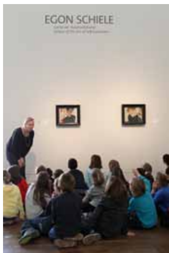
Schule schaut Museum

Die Kulturvermittlung des Leopold Museum sieht ihre Aufgabe darin, die Inhalte der Sammlung und Sonderausstellungen verschiedenen Zielgruppen in profunder Weise näher zu bringen. Das Kulturvermittlungsteam des Museums entwickelte und koordinierte im Jahr 2011 vielfältige Vermittlungskonzepte für die ständige Sammlung und die Sonderausstellungen des Hauses, deren Inhalte altersgruppengerecht aufbereitet wurden.