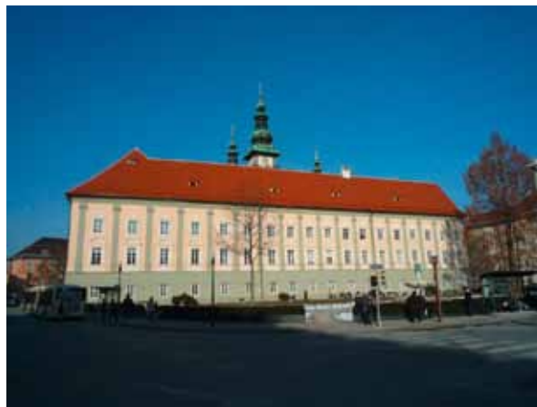
Abb. ganz links: Maria Saal, Propsteipfarr- und Wallfahrtskirche Mariae Himmelfahrt , Nordturm während der Restaurierung Abb. links: Klagenfurt, Landhaus nach Neueindeckung und Fassadenfärbelung