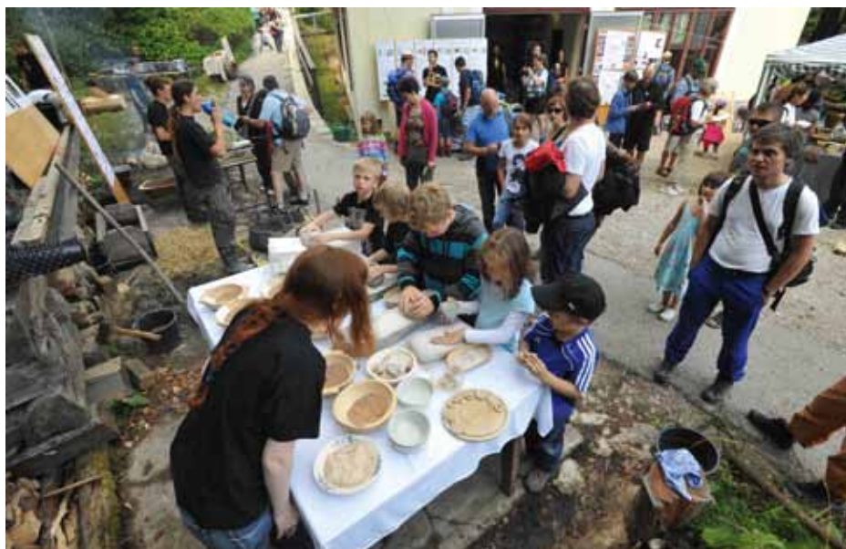
Publikumswochenende in Hallstatt

Projekt HallTexFWF: Das Projekt HallTex FWF beschäftigt sich mit Farbstoffanalysen an Geweben aus dem Salzbergwerk Hallstatt sowie mit der Reproduktion von Rips- und Brettchenwebbändern. Von der BOKU werden Färbeversuche durchgeführt, um sich dem ursprünglichen Aussehen der Gewebe anzunähern. Aufgabe von Dr. Kari-