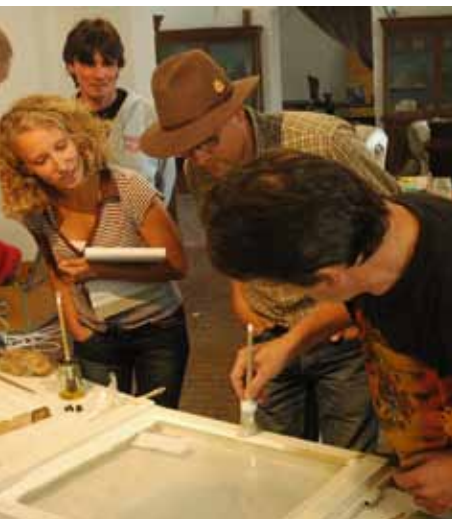
Ölstrich auf historischen Fenstern

Auf Anregung von Diözesanbauämtern und InnungsvertreterInnen der Wirtschaftskammer fand im Frühjahr 2011 für EntscheidungsträgerInnen auf Baustellen, PlanerInnen, BauleiterInnen und DenkmaleigentümerInnen erstmals ein dreiteiliges Blockseminar zum Thema Architekturoberfläche statt.