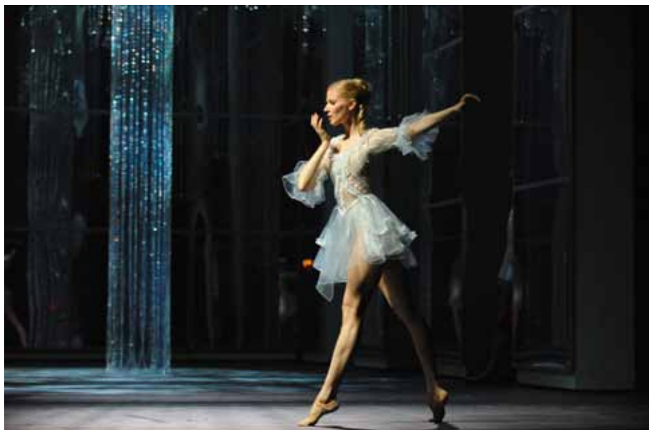
Marie Antoinette

Weitere Premieren im Haus am Ring formten die Basis zum Aufbau eines sowohl zeitgenössisch/neoklassischen als auch traditionell/klassischen und insgesamt eines bemerkenswert breitgefächerten Repertoires der Kompanie auf hohem Niveau: So der mehrteilige Ballettabend Schritte und Spuren (Kylián und Kylián-Nachfolger), Don Quixote in der Fassung von Rudolf Nurejew nach Marius Petipa (hier profitierte das Ensemble von der Erfahrung und dem Wissen Manuel Legris', der selbst die Einstudierung des Balletts übernahm) sowie Hommage an Jerome Robbins (drei Stücke von Jerome Robbins erstmalig an der Wiener Staatsoper). Auch die folgenden Premieren an der Volksoper Wien trugen zum Publikumserfolg und zur Förderung und Stärkung der Qualität des eigenen Ensembles bei: Junge Talente des Wiener Staatsballetts unter der künstlerischen Leitung Manuel Legris' und Maurice Béjarts Le Concors .