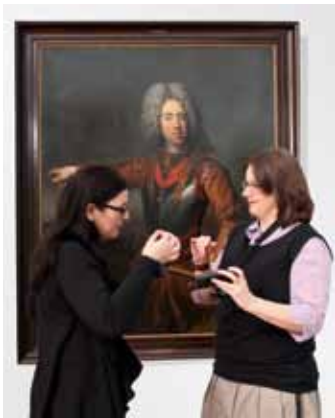
Multimediaguide in Gebärdensprache

Die vielseitige Kunstvermittlung im 21er Haus lädt seit der Eröffnung BesucherInnen aller Altersgruppen zu einem lebendigen Dialog über zeitgenössische Kunst ein. Die Palette reicht von kindgerechten Mitmachführungen bis hin zu Workshops sowie ExpertInnen- und KünstlerInnen-Gesprächen. Auf enorme Resonanz stieß das Programm am Tag der offenen Tür mit mehr als 1.500 TeilnehmerInnen. Im Unteren Belvedere und in der Orangerie wurden zehn Ausstellungen von einem umfassenden Rahmenprogramm begleitet – darunter musikalische Darbietungen, Fachvorträge und die beliebten Kunst & Kulinarik-Veranstaltungen. Vier Ausstellungen – DYNAMIK! Kubismus / Futurismus / KINETISMUS , Egon Schiele – Selbstporträts und Porträts , MAKART. MALER DER SINNE und Gustav Klimt/Josef Hoffmann. Pioniere der Moderne – konnten mittels Audioguides akustisch erschlossen werden. Einschließlich der bestehenden Audioguides im Oberen Belvedere nützten dieses Angebot 62.955 BesucherInnen. Darüber hinaus konnte das Belvedere im Berichtsjahr durch die Einführung des Multimedia-Guides in Österreichischer Gebärdensprache (ÖGS) als erstes Kunstmuseum Österreichs einen wichtigen und nachhaltigen Schritt hin zu einem barrierefreien Zugang zu Kultureinrichtungen vollziehen.