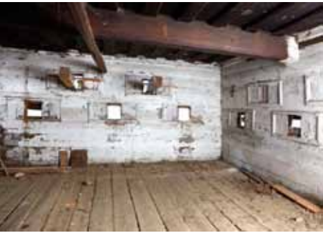
St. Georgen ob Judenburg vulgo Giefer