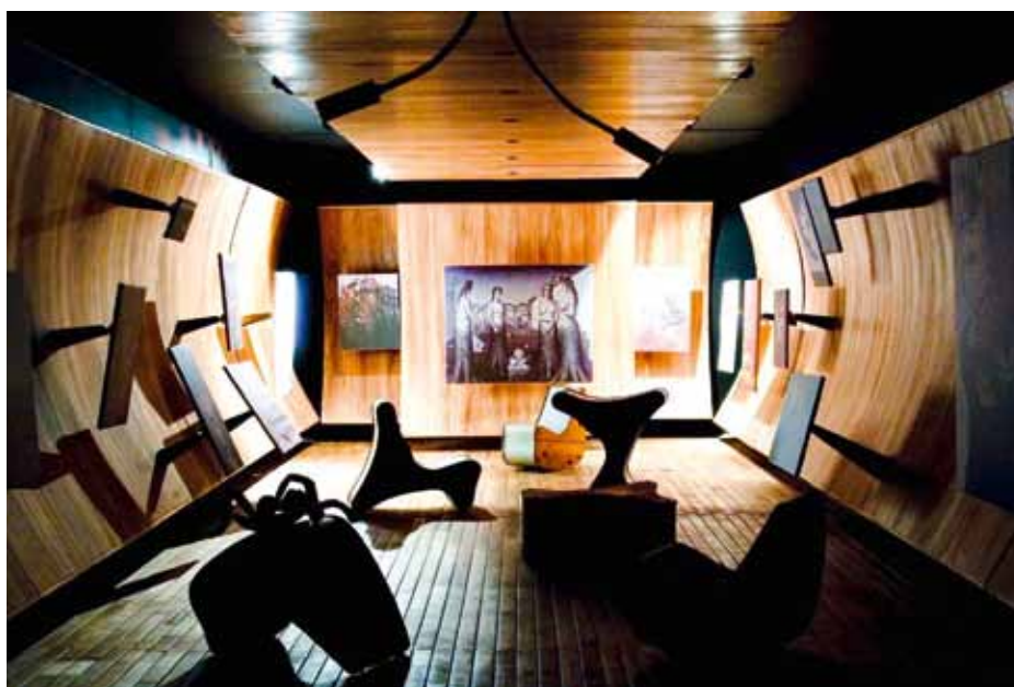
Lebensform im Kunstformat © Kiesler Stiftung