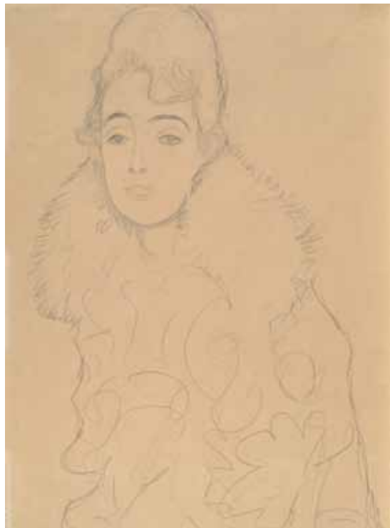
Gustav Klimt, Bildnis einer Dame 1916-17 © Albertina

Für die Architektursammlung wurde 2011 eine Ansicht des Albrechtsplatzes von Franz Hoffelner angekauft.