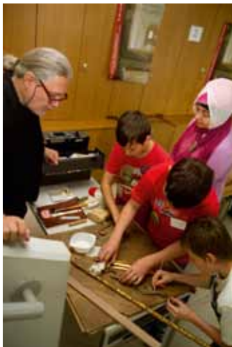
Denkmaltag für Schulen 2011, Ateliertag in der Schule

dagogischen Hochschule Wien mit dem Thema Holz&Technik . Entdecken, erforschen, recherchieren und Exkursionen zu den PartnerInnen des Projekts standen am Programm. Der Denkmaltag für Schulen fand am 11. Mai 2011 mit einem Ateliertag statt, an dem die SchülerInnen ihre Ergebnisse präsentieren, ihr Wissen erweitern und sich auf eine spannende Entdeckungsreise zu verschiedenen Forschungsgebieten begeben konnten.