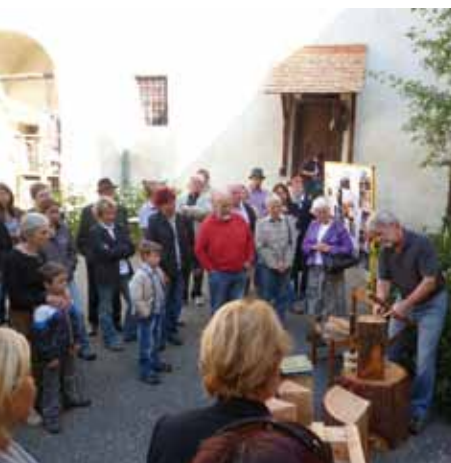
Tag des Denkmals 2011, Pichlhofen, Schloss

Der Denkmaltag für Schulen ist seit 2005 Fixpunkt in der Kulturvermittlung. 2011 konnte ein Pilotprojekt gestartet werden, das exemplarisch zeigt, wie dieser Tag im Sinne von Schulen für Schulen neu umgesetzt werden kann: Ein ganzes Projektsemester lang befassten sich Kinder und Jugendliche der beiden Praxisschulen der Pä-