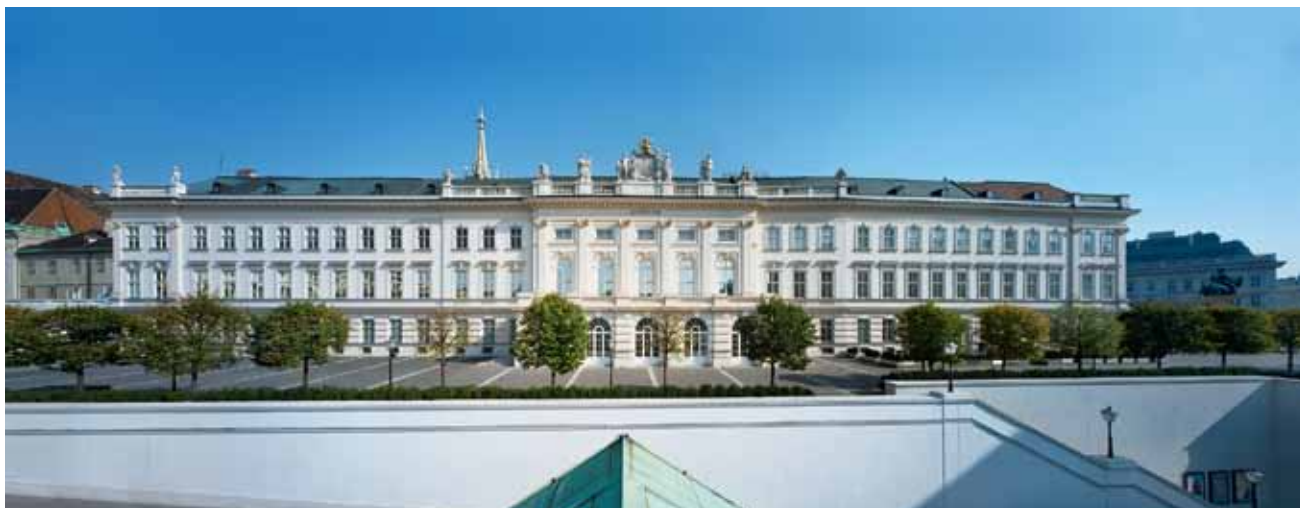
Albertina Außenansicht