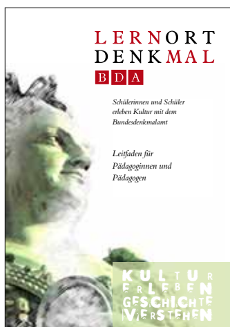
Leitfaden für PädagogInnen: LERNORT DENKMAL – Schülerinnen und Schüler erleben Kultur mit dem Bundesdenkmalamt.

Bundesweit setzte die Musisch-kreative Kooperative Mittelschule II Enkplatz in Wien-Simmering als erste Schule dieses Pilotprojekt um: Beginnend mit einem Ateliertag am 24. Oktober 2011 beschäftigen sich die SchülerInnen während des gesamten Schuljahres auf vielfältige Weise mit dem Thema Holz&Technische Denkmale auseinander. Aufgearbeitet wird der Themenkreis klassen- und fächerübergreifend, wobei verstärkt die Fächer Geschichte, Geografie, Biologie, Bildnerische Erziehung und Technisches Werken eingebunden werden. Ihre Arbeitsergebnisse werden die SchülerInnen als „spannende Geschichte(n) im Denkmal“ am Denkmaltag für Schulen Mitte Juni 2012 präsentieren. Das Motto Geschichte(n) im Denkmal wird auch das Generalthema des im Herbst 2012 stattfindenden Tag des Denkmals sein.