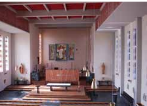
oben: Bregenz, Pfarrkirche St. Gebhard © BDA rechts: Bludenz, Bezirksgerichts- und Polizeigebäude © BDA

Im Zuge eines umfassendes Schulprojektes mit den Höheren Technischen Lehranstalten Rankweil und Bregenz wurden die nicht mehr reparierbaren Gusseisenteile des oberflächigen Wasserrades der 100 jährigen Gattersäge in Tschagguns erneuert. Mit der beratenden und finanziellen Unterstützung der Fassadenaktion Bregenzerwald und der Kulturlandschaftsfond Montafon wurden in Kooperation mit Gemeindeverbänden und dem Land wichtige Signale für die Erhaltung der Vorarlberger Kulturlandschaft gesetzt.