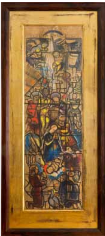
Anton Faistauer, Deo gloria eccelsis, Entwurf für das Glasfenster der Mariahilf-Kirche in Vorkloster bei Bregenz, Mischtechnik / Papier.

Ebenso wurden die angebotenen Kunstgegenstände auf zahlreichen Antiquitätenmessen und Verkaufsausstellungen begutachtet. 2011 wurde für 13 Objekte, Objektgruppen und Konvolute eine bescheidmäßige Unterschutzstellung durchgeführt. Für fünf weitere Objekte wurde die Unterschutzstellung eingeleitet. Acht Objekte, Objektgruppen und Nachlässe wurden im Zuge des Verfahrens von öffentlichen Sammlungen angekauft. Ein bereits denkmalgeschütztes Objekt wurde nach eingehender Prüfung zur Ausfuhr freigegeben, für ein künstlerisch hochwertiges Gemälde wurde nach Ankündigung eines negativen Bescheides das Ausfuhrantrag zurückgezogen. Bei einem Werk wurde das Unterschutzstellungsverfahren nach nochmaliger genauer Prüfung eingestellt, bei weiteren drei Objekten und Konvoluten wurde ein bereits bestehender Denkmalschutz bestätigt.