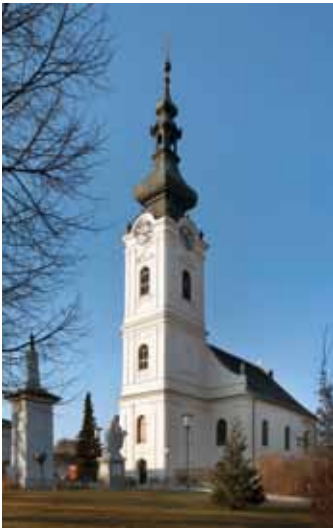
Markt Allhau, Evangelische Kirche © BDA

Schwerpunkt der kirchlichen Denkmalpflege bildete 2011 das Dekanat Güssing, wo mit der Außenrestaurierung der Franziskanerkirche in Güssing sowie der Innenrestaurierung der Filiationkirche Glasing gute Ergebnisse erzielt wurden. In Eisenstadt ergaben sich bei der Restaurierung des spätbarocken Kuppelfreskos von C. und W. Köpp in der Bergkirche neue Erkenntnisse zur Entstehungsgeschichte. Erfolgreich war auch die Innenrestaurierung der Gnadenkapelle am Kalvarienberg. Mit der Außenrestaurierung der evangelischen Pfarrkirche von Markt Allhau, einem klassizistischen Bau mit Fassadenturm von 1833, ist eine denkmalpflegerisch mustergültige Arbeit in Kalktechnik gelungen. Die ehemalige evangelische Turmschule von Tauchen wurde auf Initiative der politischen Gemeinde einer umfassenden Außenrestaurierung unterzogen.