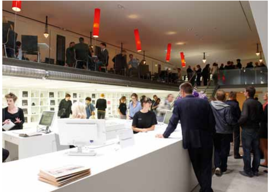
Neuer Eingangsbereich