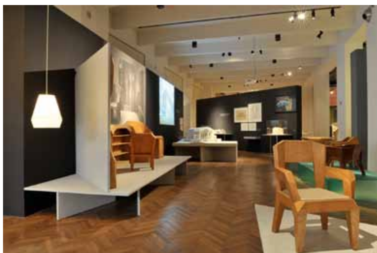
Rudolf Steiner – Die Alchemie des Alltags

Große Beachtung fand das Rahmenprogramm zur Ausstellung RUDOLF STEINER. Die Alchemie des Alltags , das sich aus Gesprächsreihen, Führungen, Eurythmieveranstaltungen und Film screenings zusammensetzte. Eine weitere Kernaufgabe der Marketing-Abteilung im Jahr 2011 stellte die Neudefinierung der Social Media-Strategien für das MAK dar.