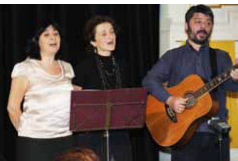
Trio Samni © Wiener Volksliedwerk

dem Programm, wobei einige Tänze den Einblick in die Fülle der Musiktradition Georgiens abrundeten. Der zweite Abend, der vom Trio Samni gestaltet wurde, stand unter dem Thema Am Anfang war das Lied... – Lieder aus Tiflis . Der Zuhörerschaft wurde die Möglichkeit geboten, die vom Georgischen ins Deutsche übertragenen Liedtexte auf der Leinwand mit zu verfolgen. Das begeisterte Publikum verabschiedete sich von den georgischen Gästen mit der Bitte an den Veranstalter, diese musikalische Begegnung unbedingt fortzusetzen.