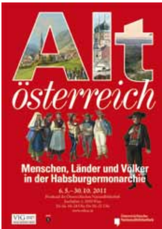
Plakat Alt Österreich

Altösterreich. Menschen, Länder und Völker der Habsburgermonarchie Prunksaal 6. Mai – 30. Oktober 2011