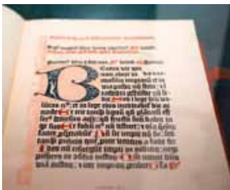
Mainzer Psalter, ONB

Die Sammlung für Plansprachen mit angeschlossenem Esperantomuseum dokumentiert an die 500 Plansprachen. Ein wesentlicher Schwerpunkt der Arbeit im Jahr 2011 lag auf der Digitalisierung des Fotobestandes und dessen Neukatalogisierung in der Datenbank Gideon, in der nun 15.000 Scans und Katalogisate zu Beständen der Sammlung online abrufbar sind.