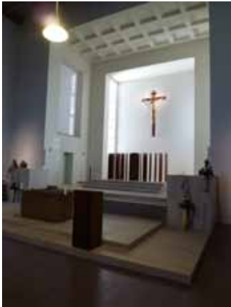
Knittelfeld, Blick in Altarraum