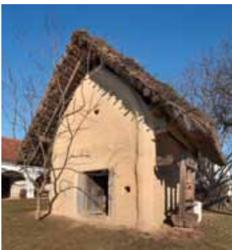
Unterschützen, Kitting

Daneben wurden Projekte fortgesetzt, wie die Freilegung der Apsismalerei der r.k. Pfarrkirche in Parndorf, die Substanzsicherung des alten Schlosses in Kittsee sowie die über einen längeren Zeitraum konzipierten Instandsetzungen der Schlösser Drassburg, Rotenturm und Kobersdorf sowie des Konventhauses in Zurndorf und des so genannten Königshofes, einer ehemaligen Zisterzienserniederlassung in Bruckneudorf.