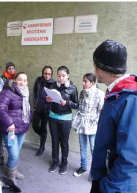
Echte Wiener

Das Projekt des in Wien ansässigen Vereins FACETTE – Vermittlungsarbeit und Ausstellungsmanagement im Kunst- und Kulturbereich , das von Oktober bis Dezember 2011 durchgeführt wurde, nahm das Viertel rund um den Hannovermarkt im 20. Wiener Gemeindebezirk als Ausgangspunkt. Dessen Besonderheiten und unterschiedliche Parallelwelten, Perspektiven, Tätigkeits- und Wahrnehmungsebenen in unmittelbarer Nachbarschaft und einem gemeinsamen Alltag sollten durch ein spezielles Vermittlungskonzept verschiedensten Zielgruppen nähergebracht werden. Ziel dieses Vermittlungsprogramms, mit dem auf unterschiedliche Altersstufen und Bildungsschichten reagiert werden konnte, war es, Distanz abzubauen, gegenseitigen Respekt und Wertschätzung zu fördern sowie ein neues Bewusstsein für andere Kulturen, gegenseitiges Verständnis und die Geschichte des Begegnungsortes und seiner BewohnerInnen zu schaffen. Bei 42 Führungen und thematischen Rundgängen mit ExpertInnen aus den verschiedensten Disziplinen sowie bei Workshops, die in Schulen des Bezirks stattfanden, und in denen politische und soziale Themen von und mit Jugendlichen erarbeitet und diese mit den Themen Interkulturalität und Vorurteile vertraut gemacht wurden, konnten die TeilnehmerInnen dazu animiert werden, sich mit ihrer eigenen Rolle in einer multikulturellen Gesellschaft auseinanderzusetzen.