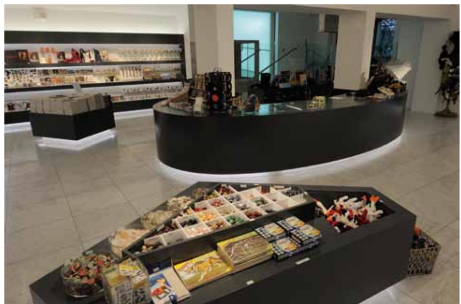
Neuer Museumsshop

Zwei Großprojekte konnten im Rahmen eines allgemeinen Erneuerungskonzeptes bereits 2011 realisiert werden: Die Renovierung und Neugestaltung der Eingangshalle inklusive Garderobenerweiterung und Errichtung eines neuen, großflächigen Museumsshops sowie die Renovierung und Neugestaltung des Dinosauriersaals