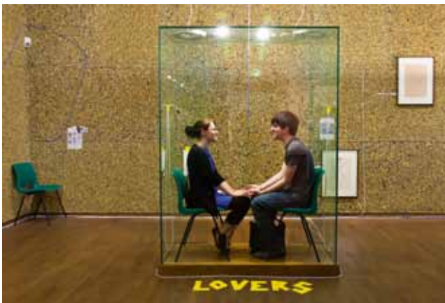
Ausstellung Melancholie und Provokation. Das Egon Schiele-Projekt

Das Leopold Museum zeigte im Jahr 2011 insgesamt sieben Sonderausstellungen. So widmete sich ab Februar die Ausstellung Florentina Pakosta dem Werk der Grande Dame der österreichischen Kunst, in deren Schaffen die kritische und feministische Betrachtung des „Männerbildes“ im Mittelpunkt steht. Die Überblicksausstellung zeigte grafische Werke aus allen Schaffensphasen und legte einen weiteren Schwerpunkt auf die abstrakten Gemälde der letzten Jahre. Die Frühlings-Ausstellung Glanz einer Epoche. Jugendstil-Schmuck aus Europa gab Einblick in die Zentren der Schmuckherstellung um 1900, mit besonderem Augenmerk auf französischer, österreichischer und deutscher Schmuckproduktion. Den Kern der Ausstellung bildete die bedeutende Schmucksammlung des Hessischen Landesmuseums in Darmstadt. Parallel zu dieser Ausstellung zeigte Prof. Peter Schubert eine Auswahl seiner Fotoarbeiten zum Thema Jugendstilarchitektur aus Europa . Der Magie des Objekts widmete sich eine Schau des SPUTNIK Fundus, die interessante Beispiele aus den Fotosammlungen von Andra Spallart und Fritz Simak präsentierte, von Ansel Adams bis Edward Weston. Zum zehnjährigen Bestand des 2001 eröffneten Hauses präsentierte das Leopold Museum im Herbst drei Jubiläumsausstellungen. Die Hauptausstellung bildete eine Hommage an Egon Schiele: Melancholie und Provokation. Das Egon Schiele-Projekt konzentrierte sich zum einen auf das expressive Frühwerk ab 1910, setzte