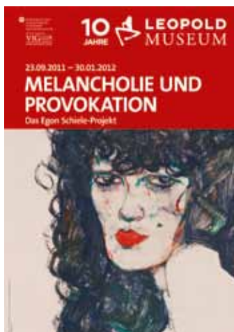
Plakat zur Ausstellung Melancholie und Provokation. Das Egon Schiele-Projekt © Leopold Museum

4. November 2011 – 30. Jänner 2012, verlängert bis 9. April 2012