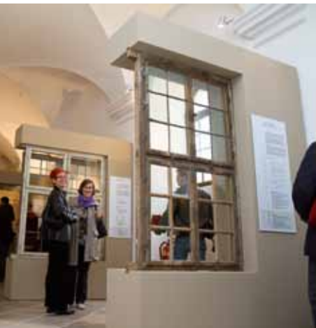
Sonderausstellung ZEITFENSTER

Die fachspezifische Weiterbildung auf dem Gebiet der Baudenkmalpflege findet in der Kartause Mauerbach statt. Die Vermittlung der vielfältigen Themen der Baudenkmalpflege, die Weiterbildung aller am Altbau tätigen Berufsgruppen und die Beratungstätigkeit für DenkmaleigentümerInnen und Ausführende bildeten im Jahr 2011 die Aufgabenschwerpunkte dieses Fachbereichs.