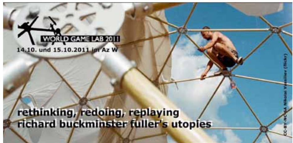
World Game Lab Flyer

Am 14. und 15. Oktober 2011 beteiligte sich die Kiesler Stiftung Wien an einem Symposium, das sich mit der Arbeit des US-amerikanischen Architekten Richard Buckminster Fuller (1895-1983) beschäftigte. Buckminster Fullers World Game Lab wurde in Kooperation mit dem Richard Buckminster Fuller Institute und dem Architekturzentrum Wien (AZW) durchgeführt und fand im AZW statt.