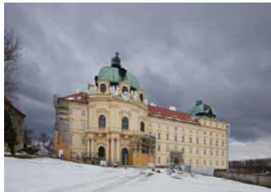
Klosterneuburg, Stift

Die Aktivitäten in den Stiften wurden auch 2011 fortgesetzt: In Altenburg konnte der Stuckmarmor und die Raumschale an der Nordseite des Kirchenovals restauriert werden, in Herzogenburg wurden die Museumsräume restauriert sowie die Ehrenhoffassaden saniert. Im Stift Zwettl konnte die Konservierung des prächtigen Hochaltars und die Reparatur der Glasfenster abgeschlossen werden. Im Stift Klosterneuburg fand die erste große Bauetappe mit der Sanierung von Dächern und Fassaden der südseitigen Hauptschauseite statt.