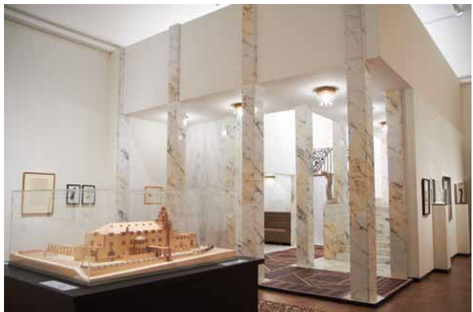
Gustav Klimt-Josef Hoffmann. Austellungsansicht