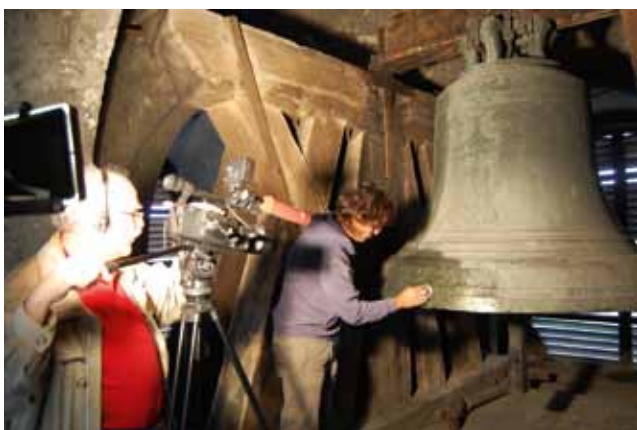
Wien, Karlskirche. Karlglocke

Weiters ist die Abteilung für historische Musikinstrumente in ganz Österreich zuständig, wobei es sich vornehmlich um die Betreuung von Restaurierungen und andererseits um die Abwicklung von Subventionsverfahren handelt. Den Großteil der betreuten Instrumente machen Orgeln und Glocken aus, in deren Erhaltung sich auf vielfältige Weise ein Stück österreichischer Musikgeschichte und Klangkultur dokumentiert.