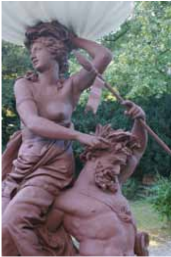
Weidling, Galateabrunnen

Pfarrkirche in Hennersdorf (Beruhigung der in Auflösung befindlichen Außenfassaden unter Bewahrung ihrer Baugenese).