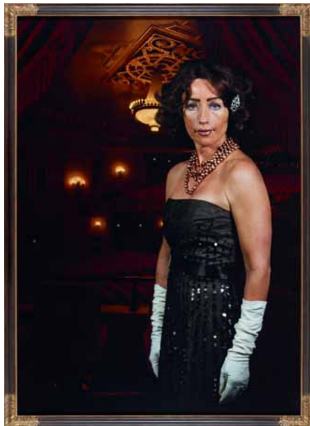
Cindy Sherman