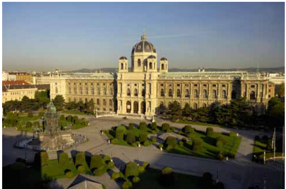
Aussenansicht