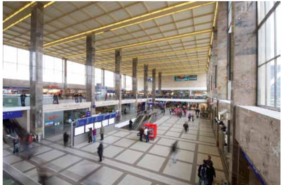
Wien 15., Europlatz, Westbahnhof nach Restaurierung

Weiters ist die Abteilung für historische Musikinstrumente in ganz Österreich zuständig, wobei es sich vornehmlich um die Betreuung von Restaurierungen und andererseits um die Abwicklung von Subventionsverfahren handelt. Den Großteil der betreuten Instrumente machen Orgeln und Glocken aus, in deren Erhaltung sich auf vielfältige Weise ein Stück österreichischer Musikgeschichte und Klangkultur dokumentiert.