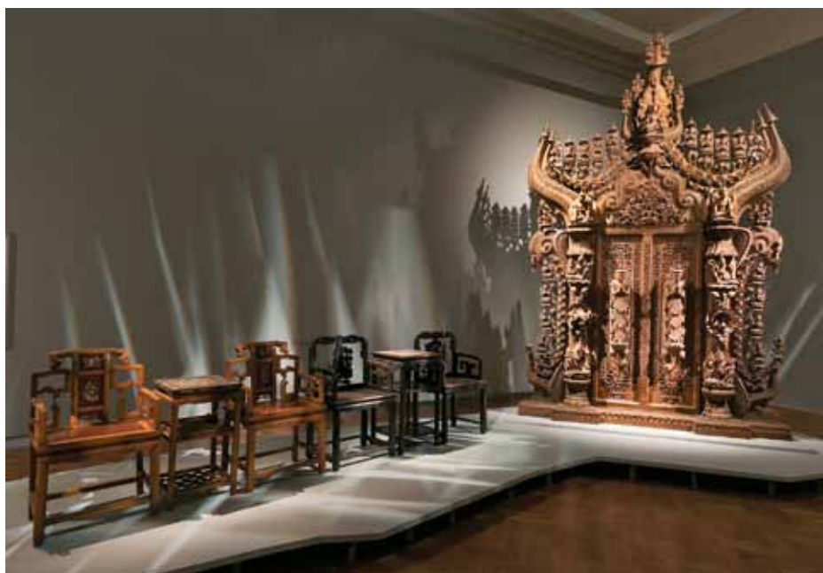
Wald / Baum / Mensch

Ab Herbst stand die Ausstellung Wald / Baum / Mensch im Zentrum der Vermittlungstätigkeit.