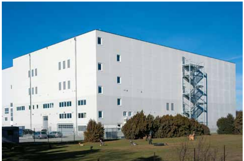
Neues Depot

Um der Vielfalt der Sammlungen und den neuen wissenschaftlichen Erkenntnissen auf dem Gebiet der Konservierung besser zu entsprechen wurde seit 2008 ein neues Depotkonzept entwickelt. Ein seit den frühen 1990er Jahren angemietetes Außendepot diente als Übergangslösung nahezu für 20 Jahre. Die Geschäftsführung entschloss sich 2010 zum Grundstücksankauf und Bau eines neuen Zentraldepots in Himberg. Der Spatenstich erfolgte im September 2010 und nach nur acht Monaten Bauzeit konnte das Gebäude am 6. Juli 2011 von Kulturministerin Dr. Claudia Schmied feierlich eröffnet werden. Es bietet auf vier Stockwerken 12.000 m 2 reine Kunstlagerfläche. Die Übersiedelung aus dem alten Depot begann im August 2011 und war mit Jahresende abgeschlossen. Das neue Depot verzichtet weitgehend auf maschinelle Klimatisierung und setzt auf Erdwärme. Das hat eine Verringerung der Betriebskosten zur Folge und stellt eine Besinnung auf Nachhaltigkeit und Erkenntnisse der letzten Jahrzehnte im Bereich der Konservierung und Materialkunde dar.