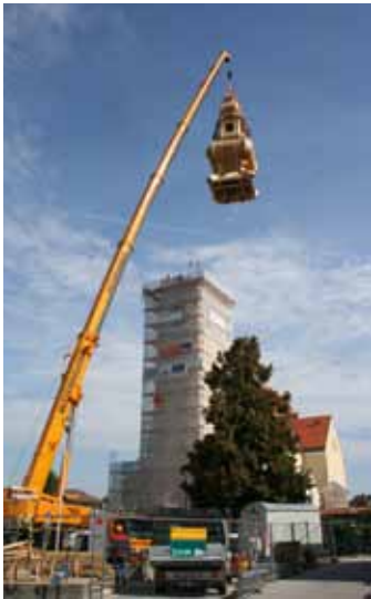
links: Gunskirchen, Wiederaufsetzen des restaurierten Turmhelmes der Pfarrkirche rechts: Ottensheim, Marktplatz 7, Neues Amtshaus