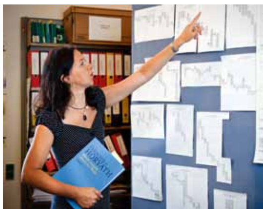
Wiener Ausgabe des Gesamtwerks von Ödön von Horváth

Die MitarbeiterInnen der ÖNB publizieren jährlich etwa 100 selbstständige und unselbstständige wissenschaftliche Publikationen. Hervorzuheben sind im Berichtsjahr die wissenschaftlichen Kataloge zu den genannten Prunksaalausstellungen sowie zur Ausstellung des Papyrusmuseums.