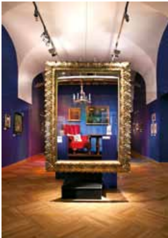
Mantel der Träume