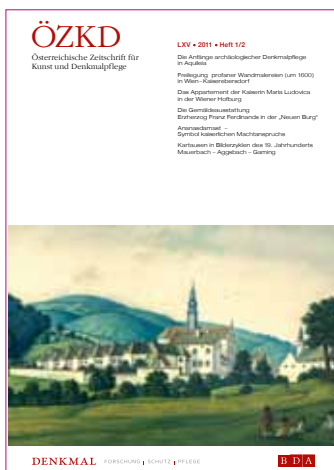
Österreichische Zeitschrift für Kunst und Denkmalpflege (ÖZKD) Heft 1/2 2011 © BDA

Denkmalverzeichnis im Internet und Denkmaldatenbank : laufende Aktualisierung sowie Verwaltung des Archivs und der Bibliothek.