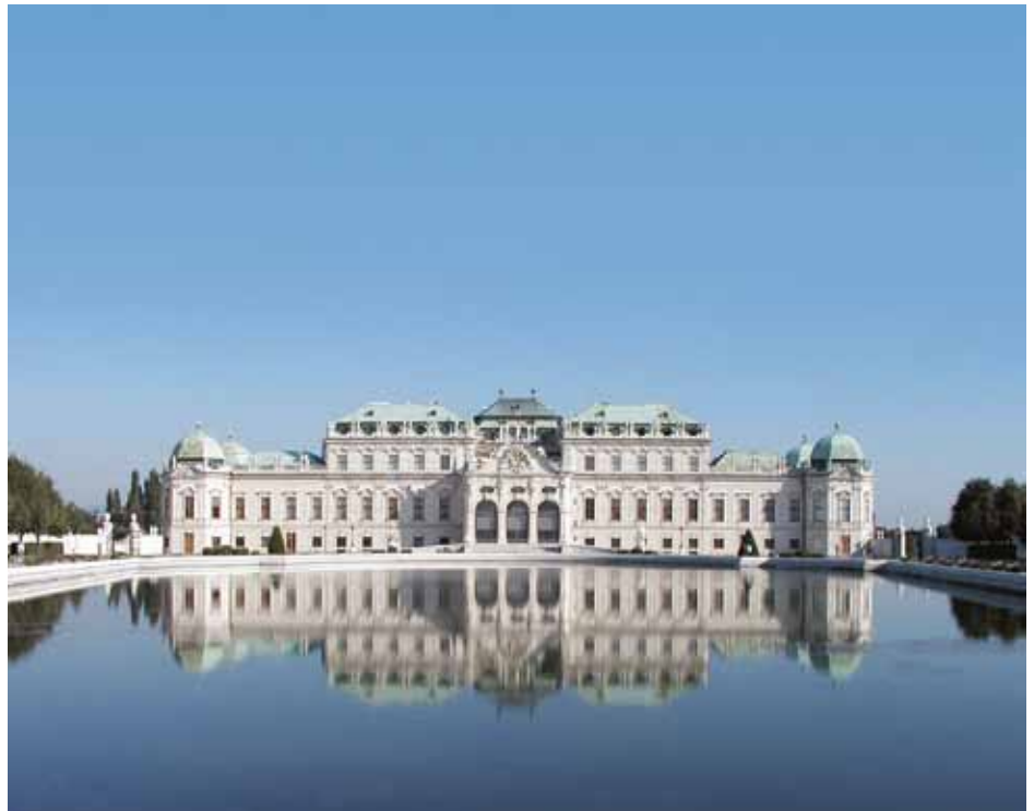
Oberes Belvedere