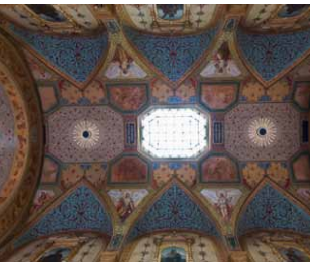
oben: Wien, Mechitaristenkirche Maria Schutz © BDA rechts: Wien, 21er Haus © BDA

Die 2011 begonnen Restaurierungsarbeiten der Kuppelfresken im Frühstückspavillon in Schönbrunn und in der Maria-Theresiengruft im Kapuzinerkloster sollen nach deren erfolgreichem Abschluss in der vom Landeskonservatorat für Wien neu entwickelten Publikationsreihe wiederhergestellt einem breiten, an der Denkmalpflege interessierten Publikum vorgestellt werden.