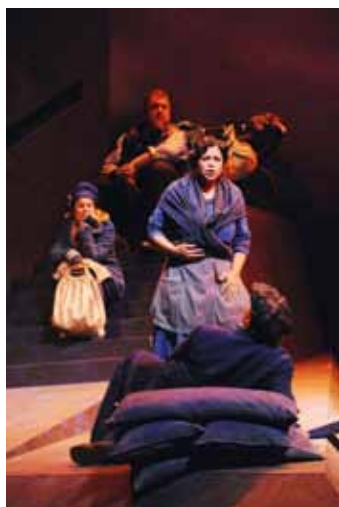
Der Mantel

Die lustigen Weiber von Windsor (Nicolai)