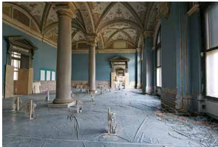
Kunstkammer, Baustelle

Ab Februar 2013 wird nach zehnjähriger Schließzeit und mehrjähriger Vorbereitungs- und Bauzeit die bedeutendste Kunstkammer der Welt wieder zugänglich sein: Die Wiedereröffnung der Kunstkammer Wien und die zeitgemäße Präsentation dieser einzigartigen Sammlung stellen eines der wichtigsten Kulturprojekte Österreichs dar und sind für das kulturelle Erbe des Landes von großer Bedeutung.