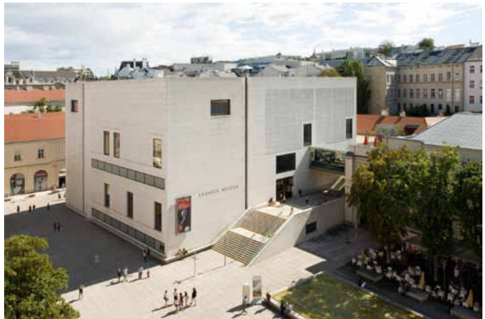
Leopoldmuseum Aussenansicht