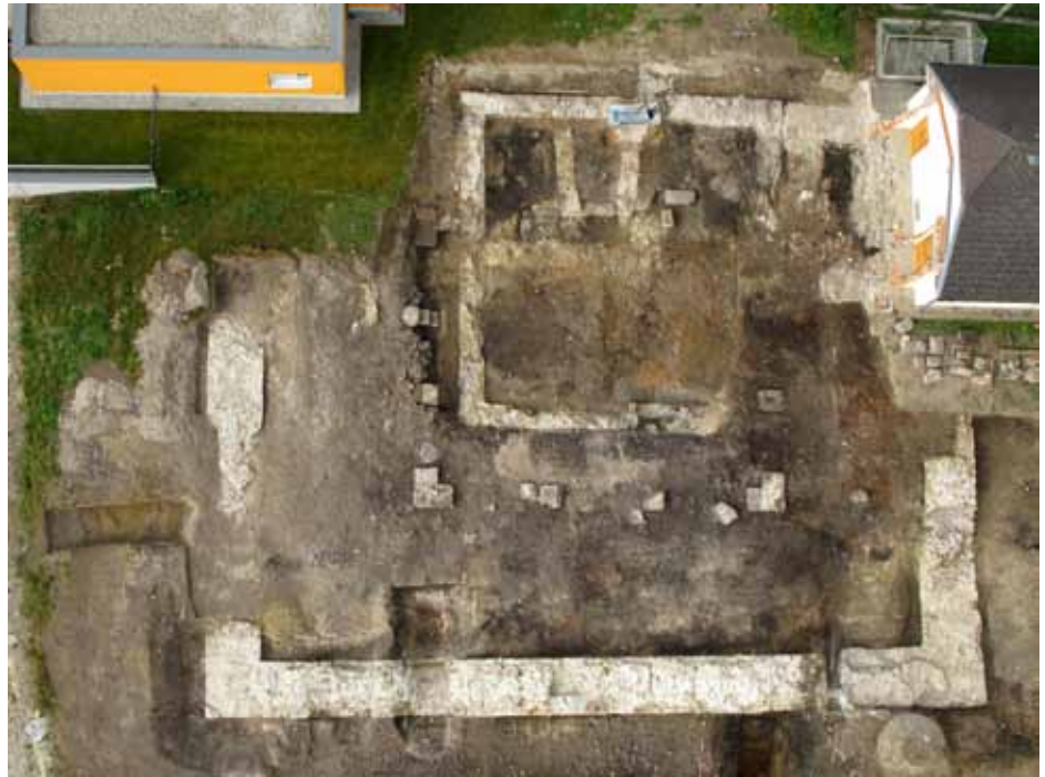
Freigelegte Baureste des spätantiken Kleinkastells von Wallsee

Die Erfolge von Erforschung, Schutz, Pflege und Vermittlung archäologischer Denkmale können wohl am besten anhand von Beispielen aufgezeigt werden, die berechnete Ansprüche von EigentümerInnen und Gesellschaft mit einbeziehen: Das spätantike Kleinkastell von Wallsee in Niederösterreich stellte dabei im Berichtsjahr einen der wichtigsten archäologischen Neufunde dar und erweitert die Kenntnisse über den römischen Limes in Österreich entscheidend. Die unmittelbar nach der Entdeckung erfolgte Unterschutzstellung hat das beabsichtigte Bauvorhaben, eine mit großem Engagement geplante Sozialeinrichtung, nicht behindert: Das Projekt wurde in eine Richtung gelenkt, die ein Zuhause für Menschen mit besonderen Bedürfnissen mit einem begehbaren und museal nutzbaren Schutzbau für ein großartiges Denkmal der ausgehenden Römerzeit vereint und damit soziale und kulturelle Anliegen zusammenführt.