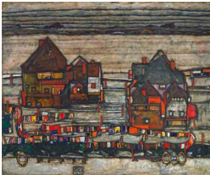
Schiele – Häuser mit bunter Wäsche, Vorstadt II